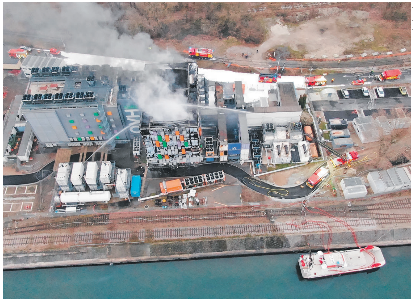
Le «cloud» parti en fumée. L'incendie qui a frappé le centre de données d'OVH à Strasbourg a bloqué plusieurs sites web suisses. En réaction, les sites en Suisse ont vérifié leurs dispositifs anti-feu pour prévenir un accident qualifié de «très rare» par Infomaniak. PAGES 5 ET 18