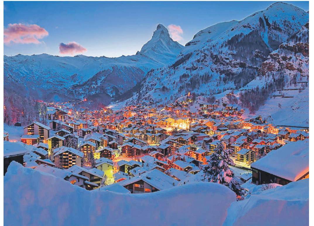
Zermatt. Malgré l'évolution du virtuel, l'immobilier reste une affaire de proximité pour le groupe, en témoigne l'ouverture d'une arcade Barnes Suisse dans la station valaisanne.

L'évolution côté gérance a été un peu moins spectaculaire, même s'il a fallu organiser le travail à distance pour les différentes activités dans un délai très court. Du côté des locataires commerciaux, la régie a dû s'assurer que les propriétaires adhèrent aux baisses de loyer, pour une prise en charge tripartite, avec l'Etat comme troisième participant. Dans une première phase, «95% des